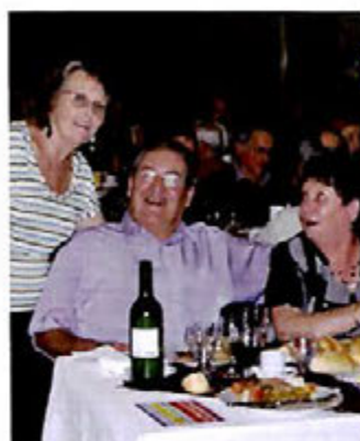
Du 9 au 15 octobre, semaine bleue : Comme chaque année, la semaine bleue a remporté un vif succès. Rencontres, spectacles et sorties ont rempli cette semaine appréciée par tous. Comme l'an passé, aux personnes ne pouvant se déplacer à la Villa pour le repas offert par la municipalité, des agents municipaux et membres du CCAS ont apporté leur repas à domicile.