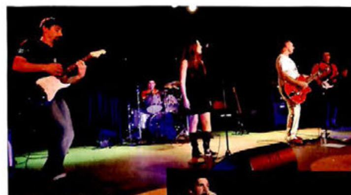
13 Novembre, Festi'villa d'Automne : Vous êtes venus nombreux à la soirée Rock'n roll, organisée par le service cultu- rel, applaudir les TKP et le groupe Steffy Mama.