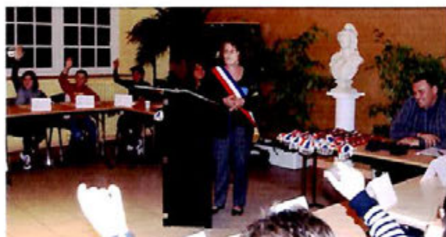
14 octobre, Conseil Municipal des enfants : Cérémonie d'installation du Conseil par Mme le Maire.