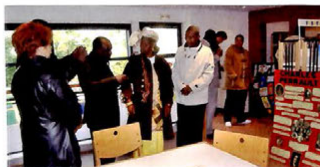
29 octobre : Dans le cadre des manifestations organisées par la CAECE pour la Coopération décentralisée, une délégation de la Ville de Kayes au Mali est venue visiter les infrastructures de la commune.