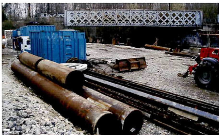
Travaux SNCF - Pont Rail de l'Essonne

Dans le cadre du programme pluriannuel d'enfouissement des réseaux, les travaux Chemin des Échaudés et Rue des Linottes viennent de s'achever avec le gravillonnage de la chaussée.