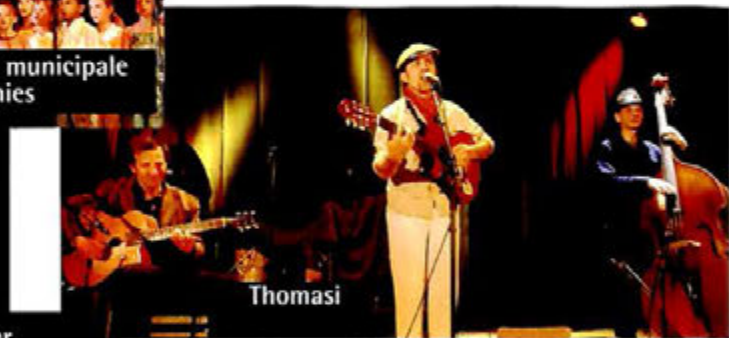
Face à la mer