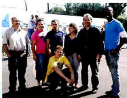
Mai 2009 : Découverte et initiation Hip Hop, Roller et graff.

Les jeunes ont crée à la bombe une fresque sur le mur du court de tennis. Un challenge roller acrobatique accompagné des danseurs de Hip Hop a clôturé cette manifestation sous les regards impressionnés de chacun.