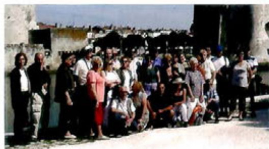
Juin 2009 : séjour en Charente Maritime pour nos Anciens, organisé par le CCAS de la Mairie de Villabé.