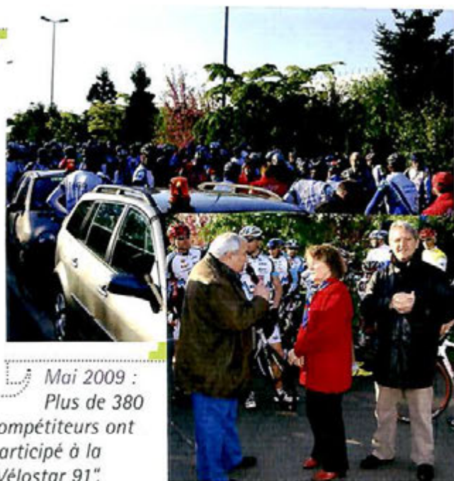
Mai 2009 : Plus de 380 compétiteurs ont participé à la "Vélostar 91".