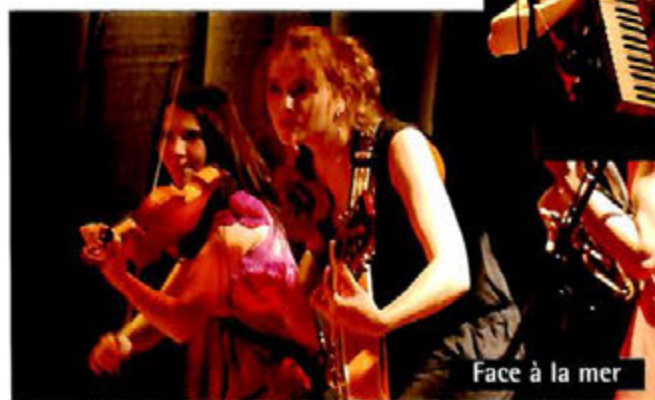
Face à la mer