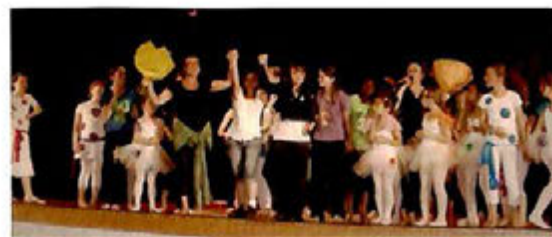
Juin 2009 : Premier Gala de l'association de danse "attitude" à la Villa, pour les petites de la section classique, et les 2 sections modern jazz.