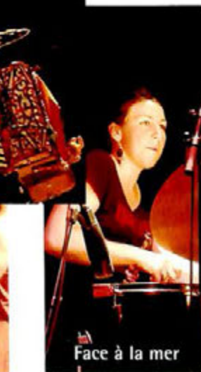
Face à la mer

Un mois de Juin en musique. Pour la 1ère édition de FestiVilla, Thomasi, El senior Igor et Face à la mer ont répondu à l'attente du public : Festivilla reviendra, avec d'autres artistes en novembre. À la Saint-Jean, les Post-it et les TKP ont enflammé la place de la gare. Lors de la fête de la musique les enfants et adultes de l'École municipale de musique Harmonies ont fait profiter de leur talent au public de l'Espace culturel la Villa.