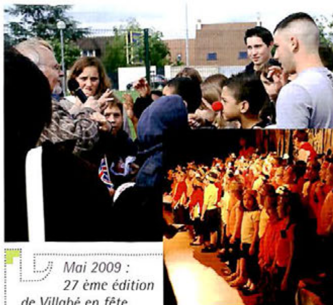
Mai 2009 : 27 ème édition de Villabé en fête Spectacle des enfants et kermesse, théâtre, danse portugaise, concours de boules, concert et le rallye.