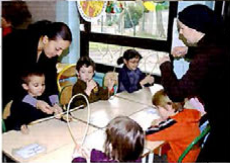
Mars 2009 : Découverte de l'osier à l'École maternelle Jean Jaurès avec "La clairière au panier".