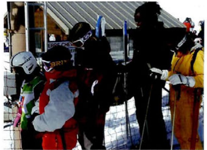
Fevrier 2009 : Séjour Ski à Serre Chevalier avec le Service Jeunesse, pendant les vacances d'hiver en plus des nombreuses activités proposées à l'Espace Jeunes.