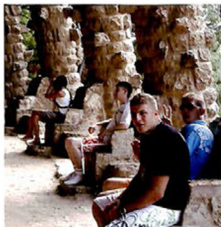
Parc Güell à Barcelone

Des séjours courts et "de découverte" en France et dans plusieurs pays d'Europe permettent régulièrement aux jeunes de la commune de partir vers d'autres horizons dans un environnement connu et en compagnie de leurs amis et des animateurs du service. Dans le cadre du jumelage avec Migliarino, des échanges entre adolescents des deux villes se sont noués. Un groupe de jeunes Italiens est ainsi