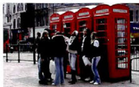
Séjour à Londres