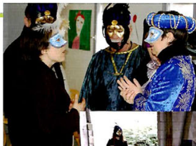
Mars 2009 : Carnaval aux couleurs de Venise et rencontre intergénérationnelle au Centre de Loisirs.