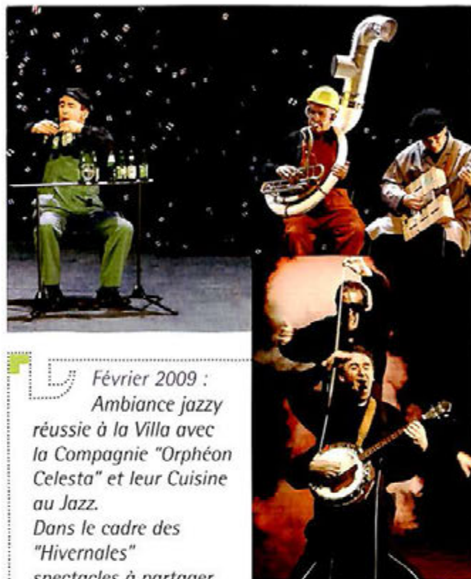
Février 2009 : Ambiance jazzy réussie à la Villa avec la Compagnie "Orphéon Celesta" et leur Cuisine au Jazz. Dans le cadre des "Hivernales" spectacles à partager.