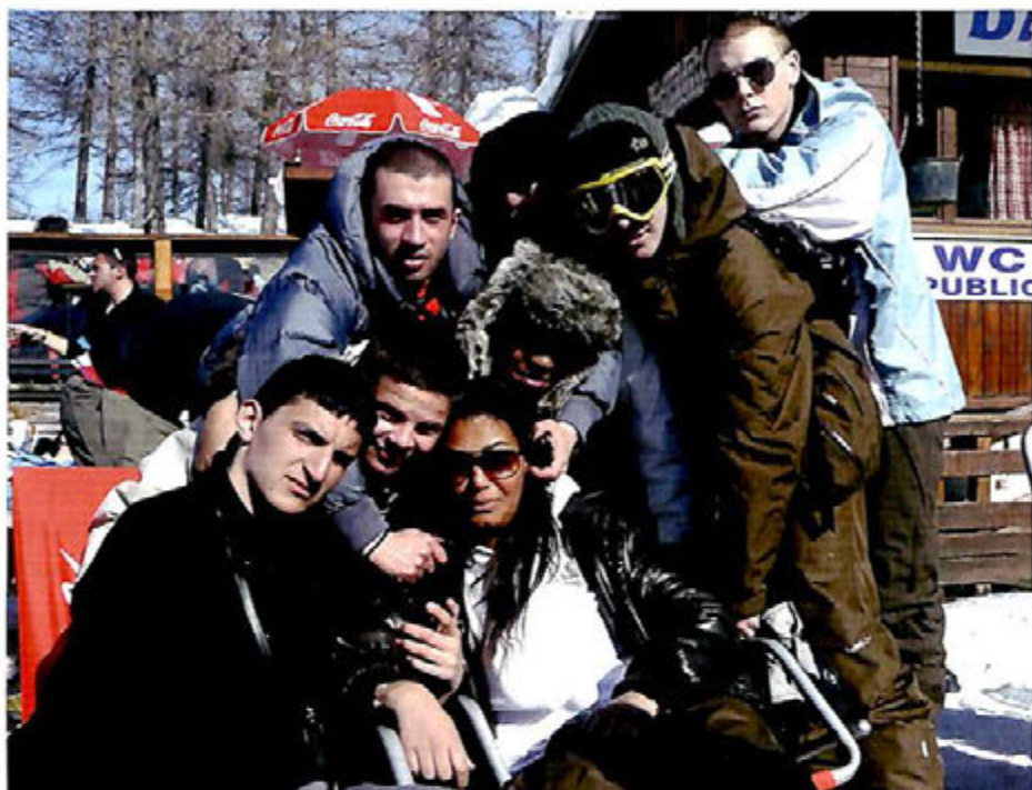
Séjour ski à Serre Chevalier